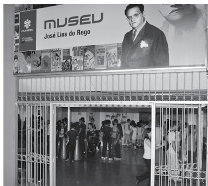
O equipamento cultural recebe um grande número de visitantes, especialmente estudantes

Em 'Poética das Coisas' é possível observar o mesmo tema sendo tratado a partir de leituras diferentes, ou releituras combinadas a partir de modos de ver que se fundem ao mesmo tempo em que se diferem. A imagem fotográfica captada de forma sublime é falada a partir de palavras que mudam de tamanho e forma de acordo com