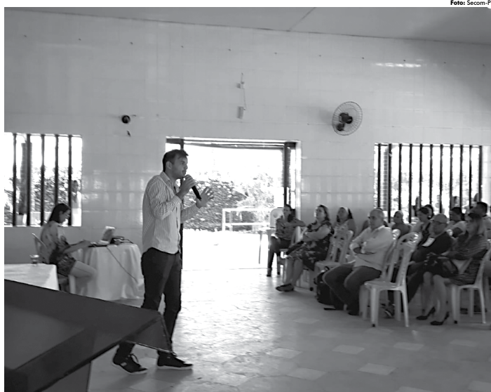
A Prefeitura de Cabedelo se integrou ao Sisan em 2015 e o atual prefeito, Victor Hugo, assinou um termo de compromisso para a elaboração do Plan-

A Prefeitura de Cabedelo se integrou ao Sisan em 2015 e o atual prefeito, Victor Hugo, assinou ontem um termo de compromisso para a elaboração do Plano Municipal de Segurança Alimentar e Nutricional no prazo de um ano. O Plano Municipal é um instrumento que define os objetivos e diretrizes para efetivação da Segurança Alimentar em consonância com as metas