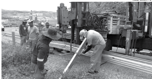
Mais 4.080 metros de defensas metálicas estão sendo implantados em trechos com alto índice de acidentes